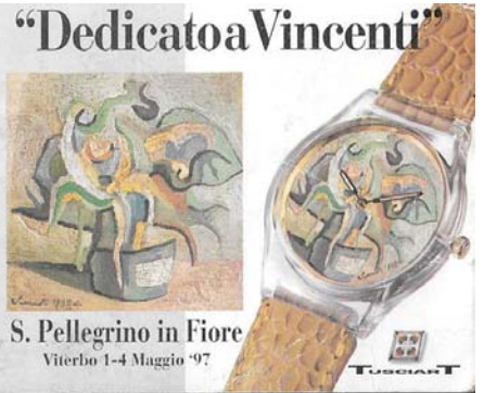
S. Pellegrino in Fiore Viterbo 1-4 Maggio '97