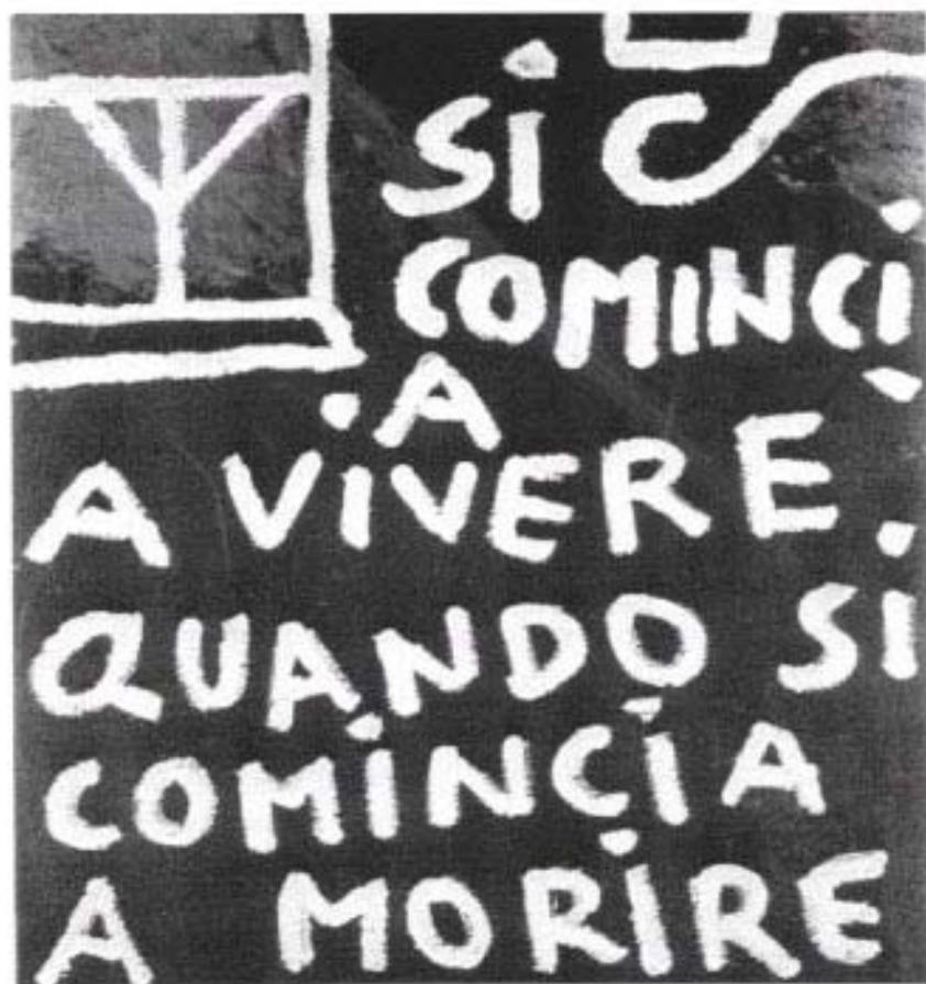
Carlo Vincenti, "Via Crucis": Tavola N.1, "La condanna a morte del Cristo", 1976

Non vorrei addentrarmi in una disquisizione approfondita su