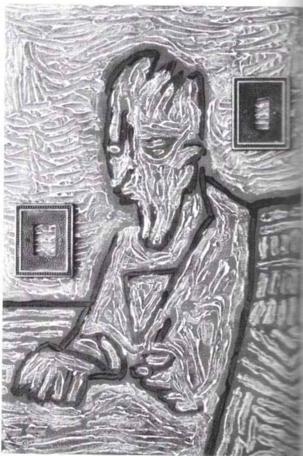
Carlo Vincenti, Ritratto, particolare da "I superstiti", 1975. Acrilico su tavola. Viterbo, Galleria d'arte contemporanea.