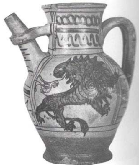
Brocca di maiolica con beccuccio tubolare «legato» al collo, dipinta a ramina e manganese con leoni e motivi geometrici, firmato e datato (1295) sulla parcia dietro l'ansa. Altr. cm. 30