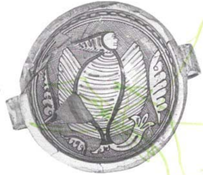
Bacino con ansa di maiolica con figura mostruosa di porco alato con testa umana su fondo a rete. ø cm. 27

GALLERIA D'ARTE MODERNA di Alberto Miralli BAGNAIA (Viterbo) - Tel. 28468