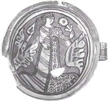
Bacino con ansa di maiolica con figura femminile e piante dipinta a ramina e manganese su fondo a rete. ø cm. 27

GALLERIA D'ARTE MODERNA di Alberto Miralli BAGNAIA (Viterbo) - Tel. 28468