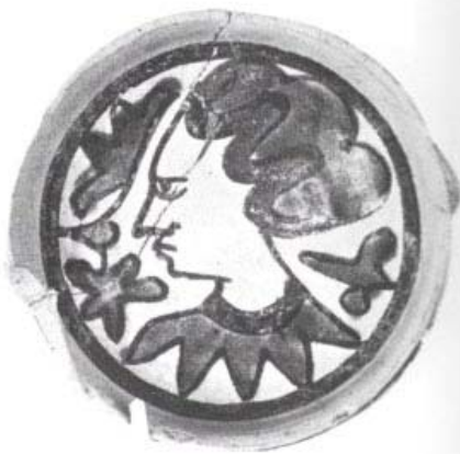
Ciotola di maiolica dipinta a ramina e manganese con ritratto di donna e fiori sul fondo. ø cm. 12