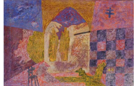
AMERICA (realtà imminente) da "La pistola di latta" (Rep. Uno) n. 12098 cm. 120x80