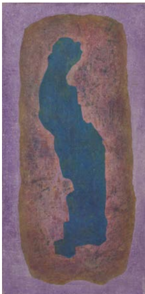
ERA BELLA da "il paradiso" (Rep. Due) n.12105 cm. 50x100