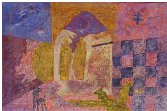
AMERICA (realtà imminente) Olio su tela cm 120 x 80 da “La pistola di latta” (Rep. Uno) 12098