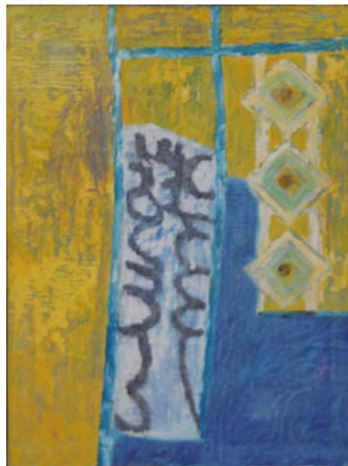
SCHELETRO BIANCO SOTTO IL SOLE da "La prima comunione" (Rep. Uno) N. 12095 cm. 45x60