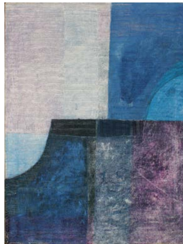
NOTTE ED ALBA da "i superstiti" (Rep. Due) n. 12108 cm. 60x80