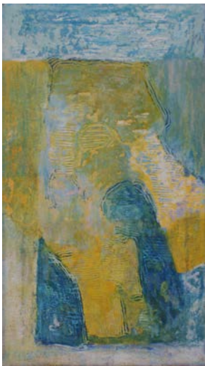
VECCHIAIA (COME LA PIU' GROSSA TITUBANZA) Da "la tonaca di G. Cristo" (rep. Due) n.12096 cm.40x70