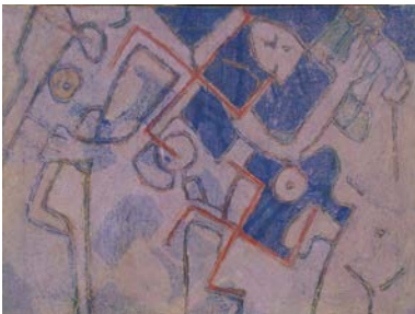
GIRANDOLE da "Ubi cumque felix" (Rep. Uno) n. 12081 cm. 80x60