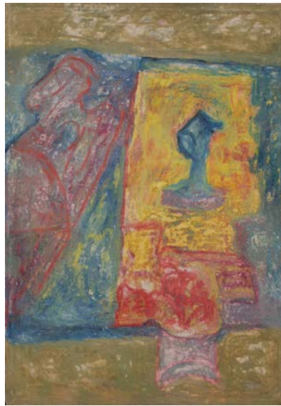
DAL N. 43 da "il quadrato" (Rep. Due) n. 12103 cm. 70x100