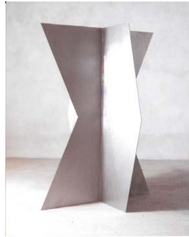
TEODOSIO MAGNONI: Decima, 2003